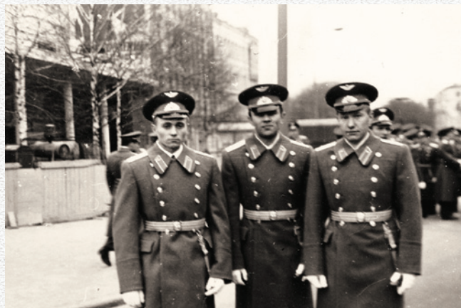
Участник Парада 7 ноября 1971 года