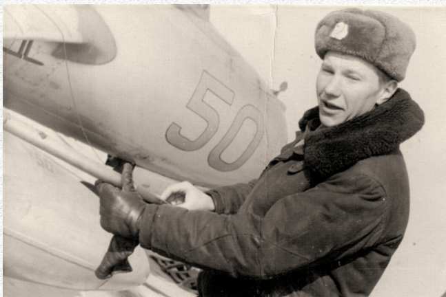
Военный городок Смуравьево. Псковская область, 1967 год